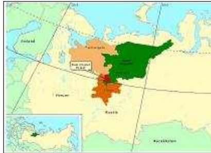
Bild Republiken Komi. Grön markering.