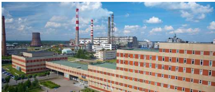
Bild; Mondi Paper, Syktyvkar.