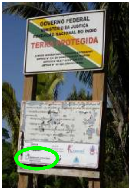
Reservatsgränsen nära Linha 621 – se MJV's symbol på den undre skylten)

stöd från MJV (dvs adoptioner, gåvor, donationer och Sida-bidrag genom Forum Syd). De säger att 621-byn är MJV's by!