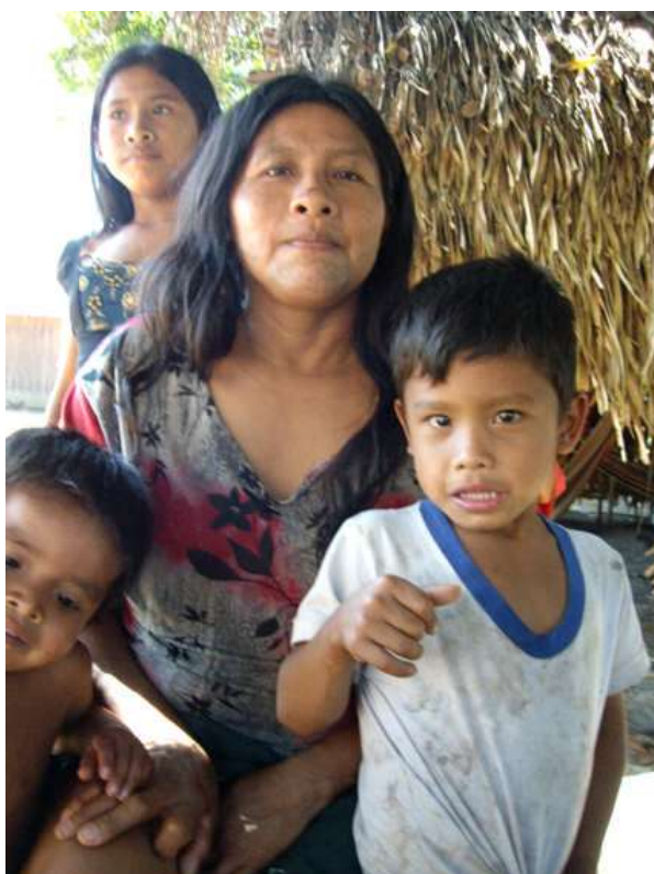
Folk i Linha 621 utanför den första hyddan, som idag används som "vardagsrum"

Utan dessa människors styrka, stolthet och övertygelse hade det aldrig fungerat så här bra. Utan Kanindé hade det inte heller gått; Kanindé har bistått med kunskap, plantor, transporter, uppbyggnad och allt stöd de har behövt längs vägen. Och vad jag vill förmedla till er som adopterat regnskog: utan er hade det inte heller gått, för allt i byn har gjorts med